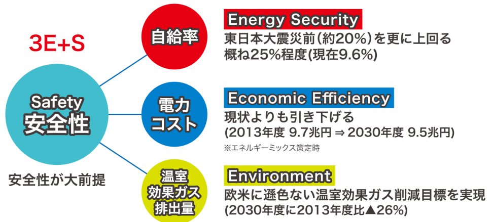
■ 2030年度のエネルギー需給構造「エネルギーミックス」

「3E+S」を達成するべく施策を講じたときに実現される、2030年度のエネルギー需給構造のあるべき姿(エネルギーミックス)については、下図の通りです。