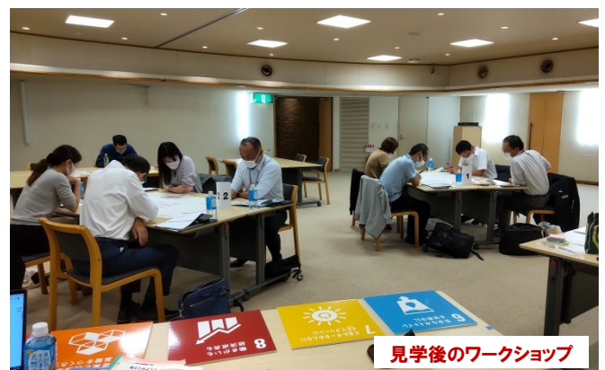
見学後のワークショップ