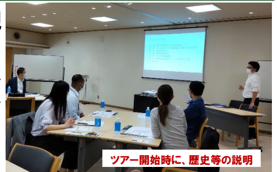
ツアー開始時に、歴史等の説明

今年度、一般社団法人黒部・宇奈月温泉観光局さんが主体となり、「黒部峡谷の歴史と文化を活用したサステナブルツーリズムの創出事業」(観光庁補助金:地域独自の観光資源を活用した地域の稼げる看板商品の創出事業)が、実施されており、当法人も参加しています。