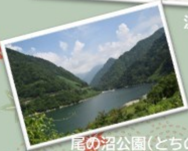
尾の沼公園(とちの湯)